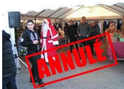
Marché de Noël organisé par le Comité des Fêtes et spectacle de Noël organisé par la Troupe "Les Amacois" annulés

des Sapeurs Pompiers du 5 décembre annulée