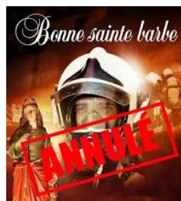
Fête de la Sainte Barbe