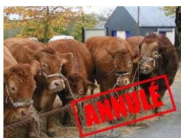
Comice Agricole et Foire Artisanale du 31 octobre annulés