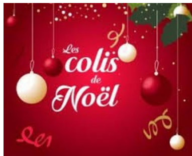
Répas de fin d'année des Aînés offert par la Municipalité via le CCAS annulé mais remplacé par un colis pour tous.